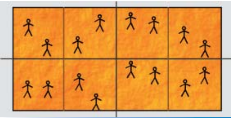
Beispiel: Aufteilung eines Beachvolleyballfeldes in 4 Spielfelder der Grösse 4,5x4,5m.

Im Rahmen verschiedener Turnierformen (z.B. King of the court), spielt immer eine gewisse Anzahl von Schülern, der Rest ausserhalb des Spielfeldes üben (z.B. Technikverbesserung). Nach einer festgelegten Zeit wechseln die Gruppen, so dass jeder Schüler nicht zu lange warten muss. Wenn letztendlich nicht genügend Felder zur Verfügung stehen, kann der Beachvolleyballunterricht auch mit dem Unterrichten einer anderen Sportart (z.B. Leichtathletik) kombiniert werden, indem die Klasse in 2 Gruppen aufgeteilt wird.